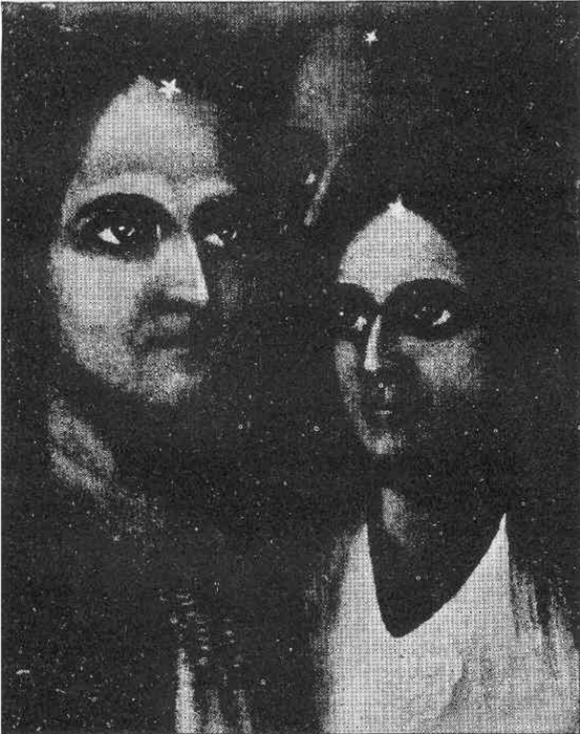
BRAHMA AND YU-TIV.

afb. 126 BRAHMA, een wetgever uit Oost-Indië, tijdgenoot van Po en Abram, Hij was een grote man met grote kracht, en nam de hoogste geestelijke plaats in van alle stervelingen. Hij vestigde de zarathoestriscche religie opnieuw in India.